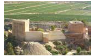
CASTILLO DE LA MOLA NOVELDA.