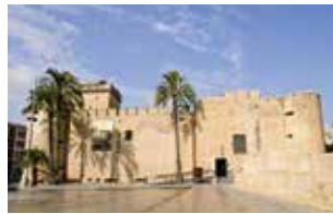
PALACIO DE ALTAMIRA ELCHE.