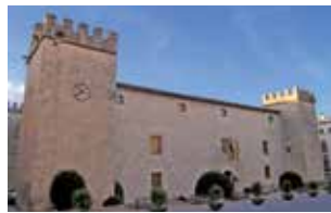
PALACIO - FORTALEZA DEL MARQUÉS DE DOS AGUAS ONIL.

Marqués de Dos Aguas palace-fortress in Onil.