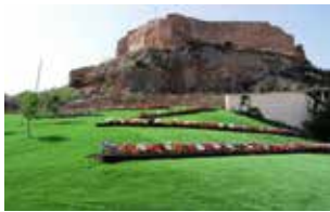
CASTILLO DE ELDA.