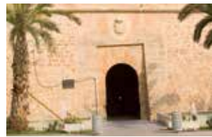
CASTILLO - FORTALEZA DE SANTA POLA.

Marqués de Dos Aguas palace-fortress in Onil.