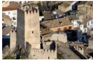
CASTILLO DE BANYERES DE MARIOLA.