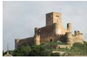
CASTILLO DE BIAR.