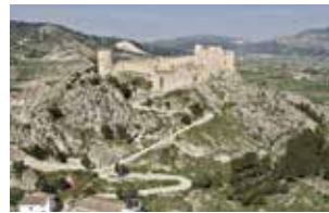
CASTILLO DE CASTALLA.