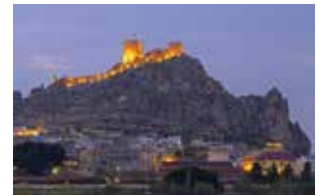
CASTILLO DE SAX.