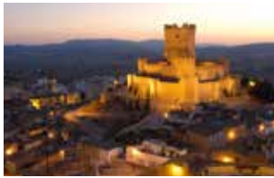
CASTILLO DE LA ATALAYA VILLENA.