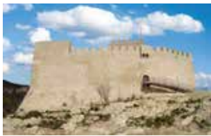
CASTILLO DE PETRER.